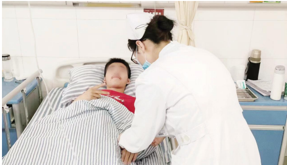
点的医疗服务。这样连续三天在返护送,全力保障他完成全部高考科目。(文/章丽丽)

为了让患者参加高考,沭阳县中医院派出专车,由张铸主治医师携带必备药械陪同,保障患者从医院到考