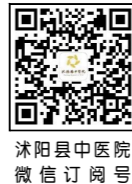
沭阳县中医院 微信订阅号

护士上门服务是医院护理工作的延续，是整体护理的重要组成部分，居家护理是非常重要的一个环节，通过互联网+护理服务，不仅为患者提供连续性医疗护理，使其出院后仍能得到全面照顾，还有效减少病人及家属往返奔波医院之苦，让患者在家就能享受到医院的优质护理服务，对于促进疾病康复，降低发病率、入院率及就医成本，进一步提升群众满意度，都发挥着十分重要的作用。