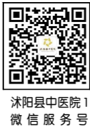
沭阳县中医院1 微信服务号

国家三级乙等中医院 南京中医药大学附属医院 扬州大学医学院附属医院 安徽中医药大学教学医院 国家级核医学科建设示范医院 江苏省中医院协作医院 江苏省人民医院技术支持医院 南京都市圈中医院合作发展联合体 东南大学附属中大医院合作医院