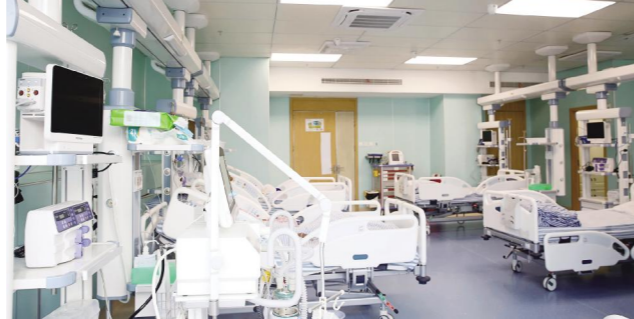
神经外科重症监护室内部环境。

神经外科重症监护室的正式启用,进一步实现了我院医疗资源的优化配置,为多类脑部疾病治疗再添有力保障,为服务百姓健康做出新的更大的贡献。