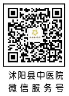
沭阳县中医院 微信服务号

国家三级乙等中医院 南京中医药大学附属医院 扬州大学医学院附属医院 安徽中医药大学教学医院 国家级核医学学科建设示范医院 江苏省中医院协作医院 江苏省人民医院技术支持医院 南京市圈中医院合作发展联合体 东南大学附属中大医院合作医院