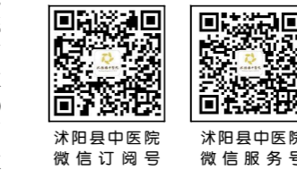
沭阳县中医院 微信订阅号 沭阳县中医院 微信服务号

团团、圆圆的父母为表示对新生儿科医护人员的感谢之情,特意送来“医德高尚暖人心 医术精湛传四方”锦旗,对新生儿科医疗、护理工作大加赞赏。(黄菊枫)