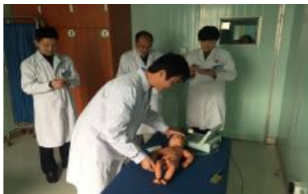
激烈角逐,共评选出36名医生进入决赛。

此次竞赛是我院“实践‘责任’承诺,保障患者安全”百日系列活动之一。本次竞赛包括初赛和决赛两部分,最终将评选出一、二、三等奖及优胜奖,并予以现金奖励。在竞赛前期,医务科组织各科室医生在技能培训中心分时段进行操练,之后由各科室上报参赛项目并推荐参赛选手名单。医务科组织18名考官,对112名参赛选手进行考核。竞赛分单人心肺复苏、婴儿心肺复苏、内科胸腔穿刺、外科无菌操作、腔镜技能及中医技能竞赛6个项目。经过近3个小时的